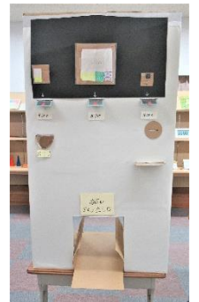
「自動販売機」 (数学科・コロナ禍における販売学習)