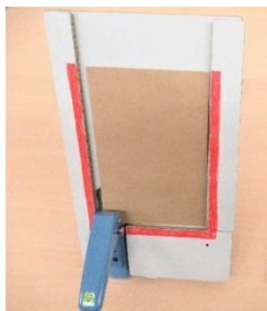
「メモ帳作り用 穴開け自助具」 (作業学習)