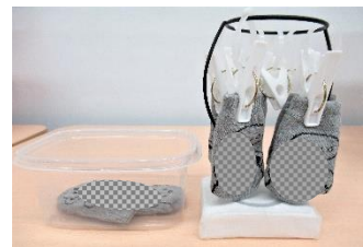
「靴下干し」 (自立活動)