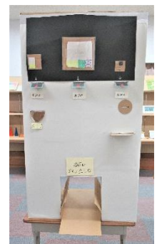
「自動販売機」 (数学科・コロナ禍における販売学習)